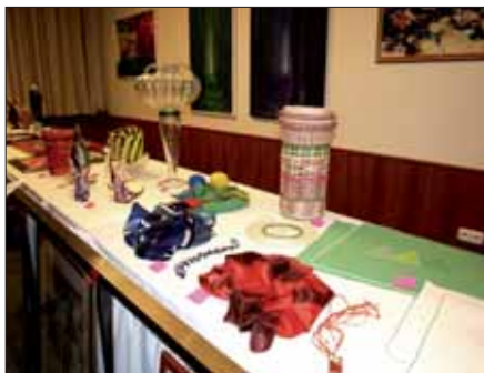
Díla studentů věnovaná k vydražení...