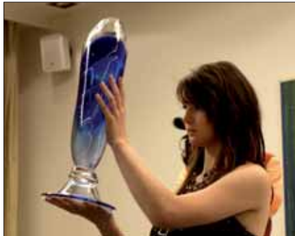
Do aukce přispěl svou nádhernou vázou také známý český umělec Bořek Šípek.