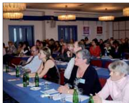
Účastníci konference ve svých sděleních věnovali pozornost mj. také novým možnostem léčby hlubokých popálenin a chronických kožních defektů...

„V blízké budoucnosti, pro naplnění kritérií pro statut Popáleninového centra, je plánována výstavba dětské jednotky intenzivní péče, která vytvoří prostředí odpovídající dětskému