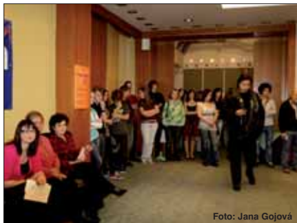
Při poslední aukci se podařilo získat rekordních 135 144 korun.

Umělecká dobročinná aukce se uskutečnila 1. prosince 2009 v Clarion Congress Hotelu Ostrava. K vydražení věnovali svá díla vedle studentů Soukromé střední umělecké školy AVE ART Ostrava, s.r.o., také studenti Střední umělecké školy textilních řemesel Praha a Střední průmyslové školy sklářské Nový Bor. Do aukce přispěl svou nádhernou vázou i známý český umělec Bořek Šípek.