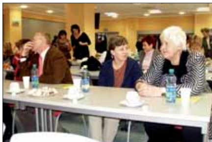
Slavnostní seminář se uskutečnil v nové konferenční místnosti v přízemí Domova sester...

Následující přednáška se zabývala poruchami spánku v dětství. Tato problematika není dosud v naší společnosti dostatečně doceňována. Přednáška byla doplněna instruktivními video-